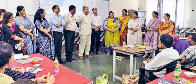
बहादुरगढ़। कार्यशाला में भाग लेते प्रिंसिपल व शिक्षक।

■ आधुनिक शिक्षण विधियों और तकनीकों के बारे में कराया अवगत