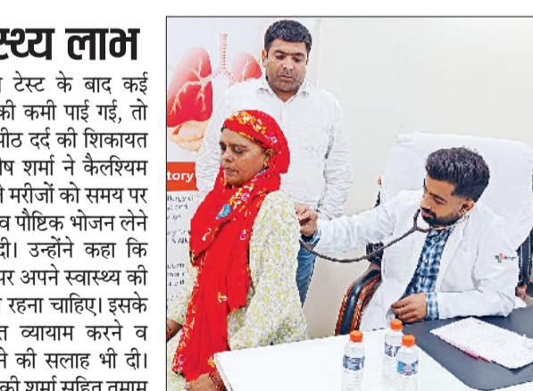
बहादुरगढ़। शिविर में महिला की जांच करते चिकित्सक।