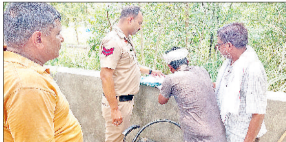
झज्जर। दाह संस्कार के लिए शव को नगर परिषद कर्मचारियों को सौंपने संबंधी दस्तावेजों पर हस्ताक्षर कराते हुए पुलिसकर्मी।

इसके व मौके पर पहुंचे तथा राहगीरों फंदे से नीचे उतरवाकर उसे की सहायता से शव को फांसी के पोस्टमार्टम के लिए स्थानीय