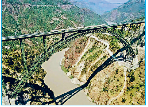
चिनाब ब्रिज : दुनिया का सबसे बड़ा आर्च ब्रिज

हा ल ही में देश के प्रधानमंत्री नरेंद्र मोदी ने जम्मू-कश्मीर में नवनिर्मित चिनाब पुल का उद्घाटन किया। यह (चिनाब पुल) दुनिया का सबसे ऊंचा रेलवे पुल है। ब्रिज की खासियत: चिनाब ब्रिज स्टील और कंक्रीट से बना आर्च ब्रिज है, जो रियासी जिले के बक्कल और कौरी गांवों को जोड़ता है। इसकी सबसे बड़ी खासियत यह है कि यह नदी के तल से 359 मीटर (लगभग 1,178 फीट) ऊंचा है। यानी यह पेरिस के मशहूर एफिल टॉवर से 35 मीटर और दिल्ली की कुतुब मीनार से करीब 5 गुना ऊंचा यानी कि 287 मीटर ऊंचा है। यह 266 किमी प्रति घंटे तक की हवा की गति का सामना कर सकता है। यह ब्रिज भूकंपीय क्षेत्र पांच में स्थित है इसलिए इसे इतना मजबूत बनाया गया है कि रिक्टर स्केल पर 8 तीव्रता के भूकंप को भी सहने में सक्षम है। यही नहीं इसे 40 टन टीएनटी के बराबर विस्फोट सहने में सक्षम बनाया गया है। इसमें ऐसे खास जंगरोधपट्टे का इस्तेमाल किया गया है, जो इसे 20 साल तक जंग से बचाएगा। पुल में ऐसी तकनीक स्थापित की गई है कि कोई भी खतरा होने पर वार्निंग अलार्म खुद ही बजने लगेगा। पुल में 112 सेंसर लगाए गए हैं, जो हवा की गति, टेम्परेचर और कंपन आदि की जानकारी देंगे।