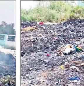
जब कचरा ज्यादा हो जाता है तो इसे आग के हवाले कर दिया जाता है। जिस कारण दुर्गंध के