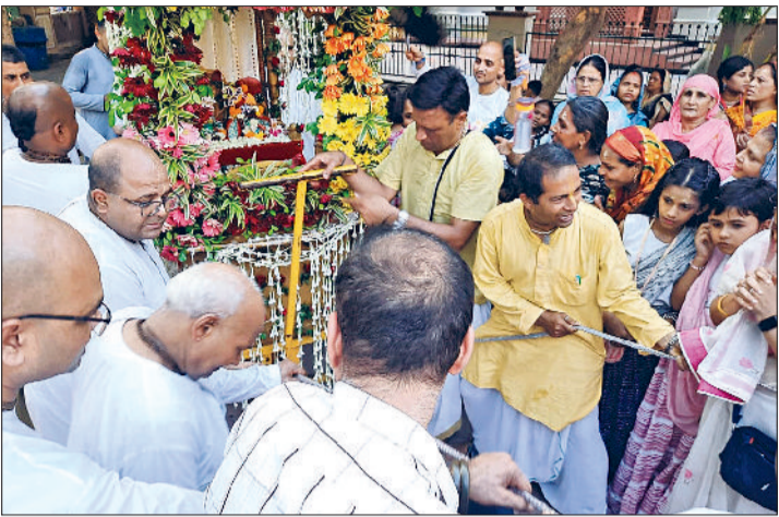
हरिभूमि न्यूज ►► बहादुरगढ़

लाइनपार स्थित इस्कॉन मंदिर की ओर से शहर में भगवान जगन्नाथ की यात्रा उत्साह के साथ निकाली गई। इस उपलक्ष्य में मंदिर को फूलों से सजाया गया। कई दिन से कार्यक्रम की तैयारियां चल रही थी। सुबह