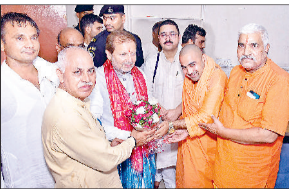
बेरी। कार्यक्रम में पहुंचने पर पुष्पगुच्छ देकर स्वागत करते आयोजक समिति सदस्य।

संस्कृत को विश्व की सबसे पूर्ण भाषा माना गया है, जोकि देश की एकता व अखंडता को एक सूत्र में बांधती है। आज समाज को यह जिम्मेदारी लेनी चाहिए कि हमारी युवा पीढ़ी अपनी भाषा, अपनी संस्कृति को आगे बढ़ाए, ताकि देश व समाज को सशक्त बनाया जा सके। यह बात सहकारिता, कारागार, निर्वाचन, विरासत व पर्यटन मंत्री डॉक्टर