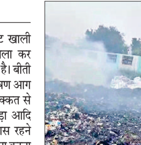
बहादुरगढ़। आग के चलते कचरे से उठता धुआं तथा ड्रेन के पास जला हुआ इंडस्ट्रियल वेस्ट।

एमआईई में वेस्ट जुआं ड्रेन के निकट खाली पड़ी जमीन पर आए दिन कचरा जला कर पर्यावरण को नुकसान पहुंचाया जा रहा है। बीती रात को भी यहां इंडस्ट्रियल वेस्ट में भीषण आग लग गई। दमकल कर्मियों ने कड़ी मशक्कत से आग पर काबू पाया। केमिकल, चमड़ा आदि जलने से फैले धुएं के कारण आसपास रहने वाले लोगों को काफी परेशानी का सामना करना पड़ा। दरअसल, बहादुरगढ़ के एमआईई में वेस्ट जुआं ड्रेन के निकट खाली जमीन पर काफी समय से फैक्ट्रियों का कचरा डाला जा रहा है।