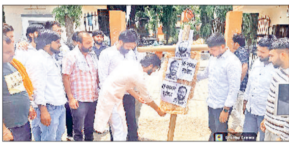
झज्जर। राजकीय नेहरू कॉलेज परिसर में सीएम का पुतला फूंकते हुए एनएसयूआई संगठन के पदाधिकारी।