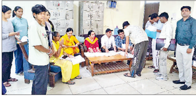
झज्जर। नेहरू कॉलेज परिसर में दाखिले के लिए दस्तावेजों की जांच करवाते हुए विद्यार्थी।

साइंस की 300, बीएससी लाइफ साइंस की 80 तथा बीसीए की 80 सेंटें हैं। जिन की 80, बीएससी गणित की 40, बीबीए विद्यार्थियों का नाम मेरिट लिस्ट में आया है