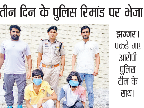
झज्जर। पकड़े गए आरोपी पुलिस टीम के साथ।