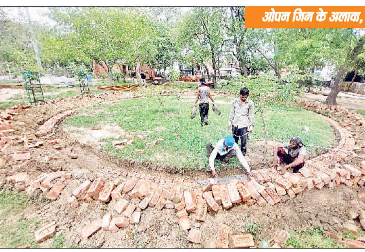
झज्जर। शहर के शहीदी पार्क को आधुनिक लुक देने में जुटे राज मिस्त्री व शहीदी पार्क में फुटपाथ पर बिछाने के लिए रखी टाइलें।

पिछले काफी समय से मूलभूत सुविधाओं से वंचित शहर के शहीदी पार्क की नगर परिषद द्वारा सुध ली गई है। पार्क के सौंदर्यकरण को लेकर भारी भरकम राशि खर्च कर आधुनिक लुक दिया जा रहा है। पार्क के सौंदर्यकरण का कार्य जोरों पर चल रहा है। पार्क के सौंदर्यकरण पर करीब पौने तीन करोड़ की लागत का अनुमान लगाया गया है। जिसके तहत पार्क में आधुनिक फव्वारे, बेहतरीन लाइटिंग व्यवस्था, मखमली घास, पानी निकासी की समुचित व्यवस्था, टूटे फुटपाथ की मरम्मत व उस पर टाइलें बिछाना, ओपन जिम व आर्कषक झूले लगाने की योजना को अमलीजामा पहनाया जा रहा है। इसके अलावा पर्यावरण व जल संरक्षण को लेकर भी कार्य किए जाएंगे। जल संरक्षण के लिए जहाँ पार्क में बड़े-बड़े टैंक बनाए जाएंगे, वहीं पौधारोपण भी किया जाएगा। बरसाती पानी को टैंकों में एकत्रित किया जाएगा। जिसे बाद में पौधों की सिंचाई के कार्य में लाया जाएगा। बता दें कि झज्जर बहादुरगढ़ मार्ग पर स्थित शहीदी पार्क ऐतिहासिक पार्क है। इसमें शहीदों के स्मारक के अलावा ऐतिहासिक बुआ हसन का तालाब भी है। जिसे देखने के लिए दूर दराज क्षेत्रों से लोग आते हैं।