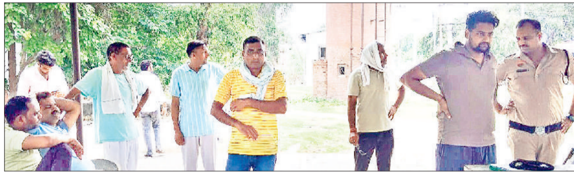
झज्जर। नागरिक अस्पताल परिसर में उपस्थित परिजन और पुलिसकर्मी।